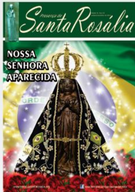
imagem de Nossa Senhora, machucada e enegrecida, encontrada no Rio Paraíba do Sul, iniciou a devoção muito forte em 1717, quando pescadores não conseguiam encher de peixes suas redes, e após o aparecimento da imagem, ocorreu o sucesso em seus trabalhos de pescadores. Após longos anos, o presidente Getúlio Vargas, em 1931, reconheceu Nossa Senhora Aparecida como Padroeira do Brasil.