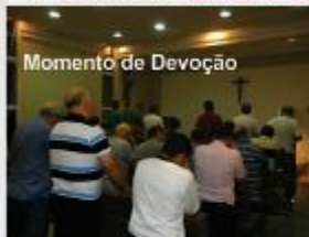
Momento de Devolução