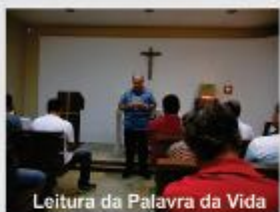
Leitura da Palavra da Vida