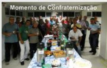
Momento de Cõnfraternização