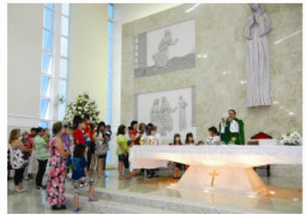
Missa com as crianças